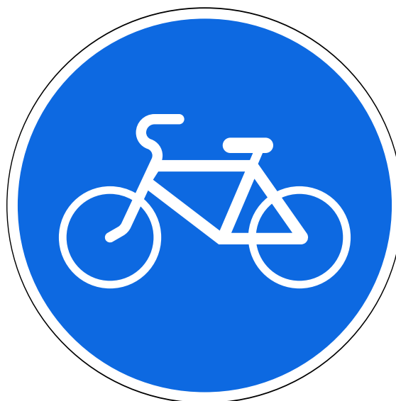
Знак 4.4 «Велосипедная дорожка»

Велосипеды должны двигаться по велосипедной, велопешеходной дорожкам или полосе для велосипедистов (ПДД 24.1), а при их отсутствии или возможности движения по ним допускается движение «по правому краю проезжей части» [4] . Также допускается движение по обочине при отсутствии возможности двигаться по всем вышеперечисленным типам дорог.