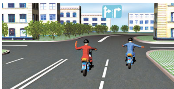
Оба участника движения сигнализируют о повороте направо