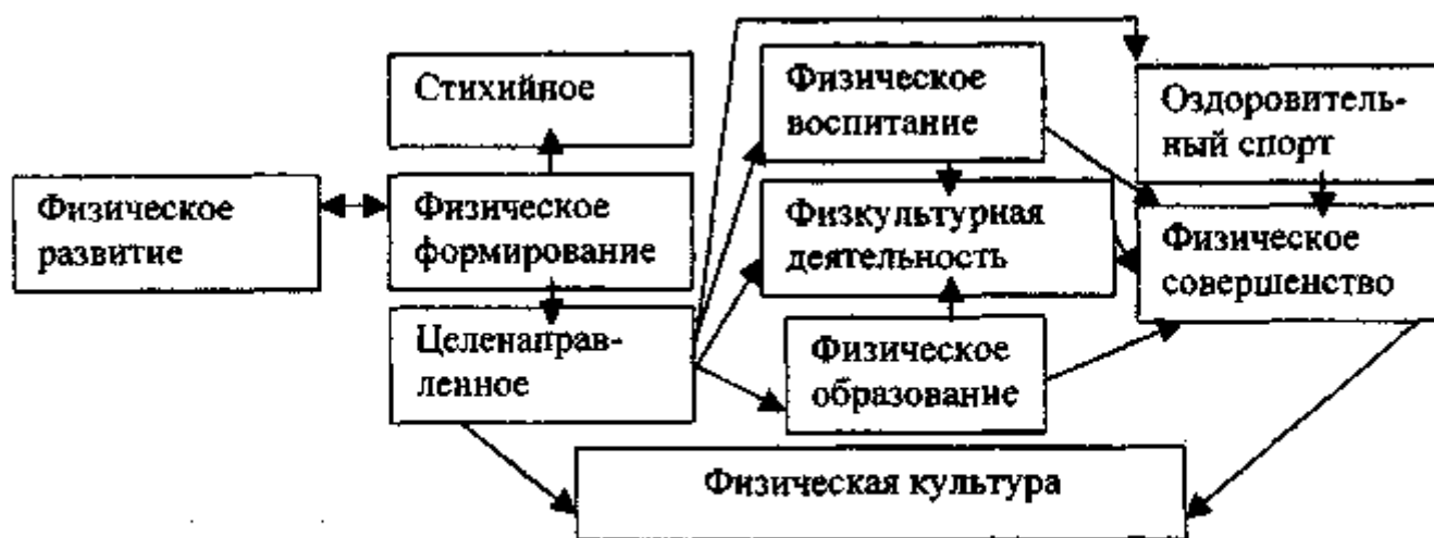
Рис. 2. Система категорий ТФК

Под категориями понимают наиболее общие, фундаментальные понятия. Понятия — это мысленное отражение общих, существенных и устойчивых признаков явлений и предметов. Таким образом, с помощью категорий отражены наиболее существенные и общие признаки физической культуры. Последовательное развертывание содержания понятий позволяет нам выработать систему категорий ТФК (рис. 2).