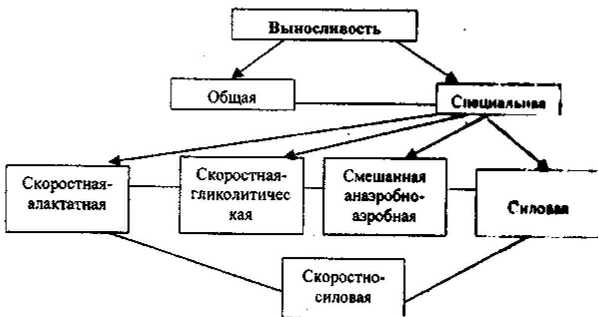
Рис. 4. Классификация видов выносливости

Скоростная-алактатная выносливость — это способность противостоять утомлению в кратковременной работе максимальной интенсивности (около 20 секунд).