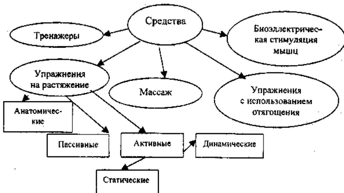
Рис. 5. Средства развития гибкости

Дозировка нагрузки. Количество повторений в одном подходе: 10 - 12 активных движений, 10 - 15 маховых, 6 - 12 секунд статических, 10 - 20 пассивных. Интервалы отдыха — от 10-15 секунд до 2 - 3 минут между подходами. Если используются упражнения с отягощениями, то вес отягощения не должен превышать 50 % от максимального.